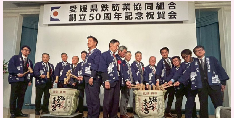
祝賀会の様子(鏡開き)

交通基盤も岐阜県の発展を支える重要な要素です。東海北陸自動車道や東海環状自動車道が飛騨・美濃、さらには東海・北陸・中部圏を結び、広域ネットワークを形成しています。名神高速道路は県南部を東西に貫き、関西・中京圏を結ぶ大動脈として物流・産業活動を支えています。また、東海道新幹線の岐阜羽島駅は県南部の重要な玄関口として機能し、ビジネスや観光の利便性向上に寄与しています。さらに近